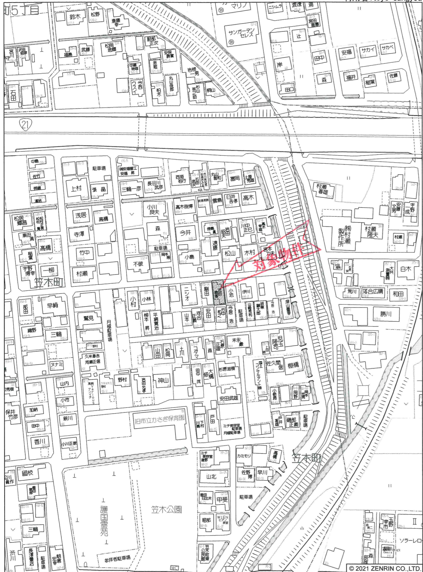
大垣市笠木町付近