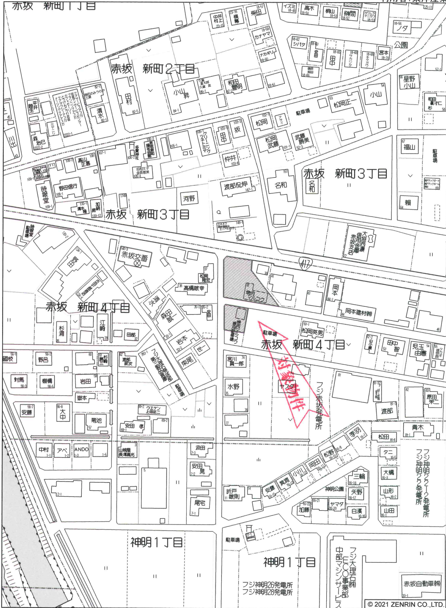
大垣市赤坂 新町4丁目付近