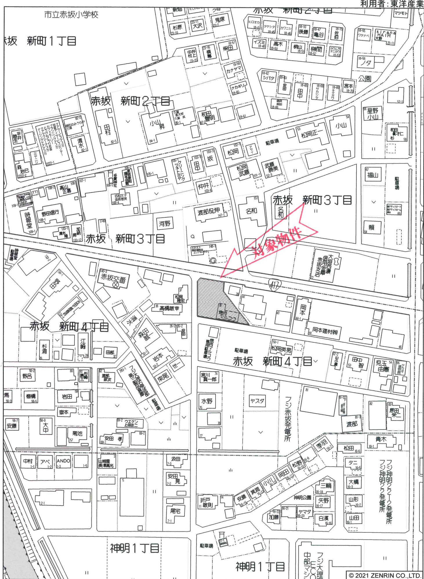
大垣市赤坂 新町4丁目付近