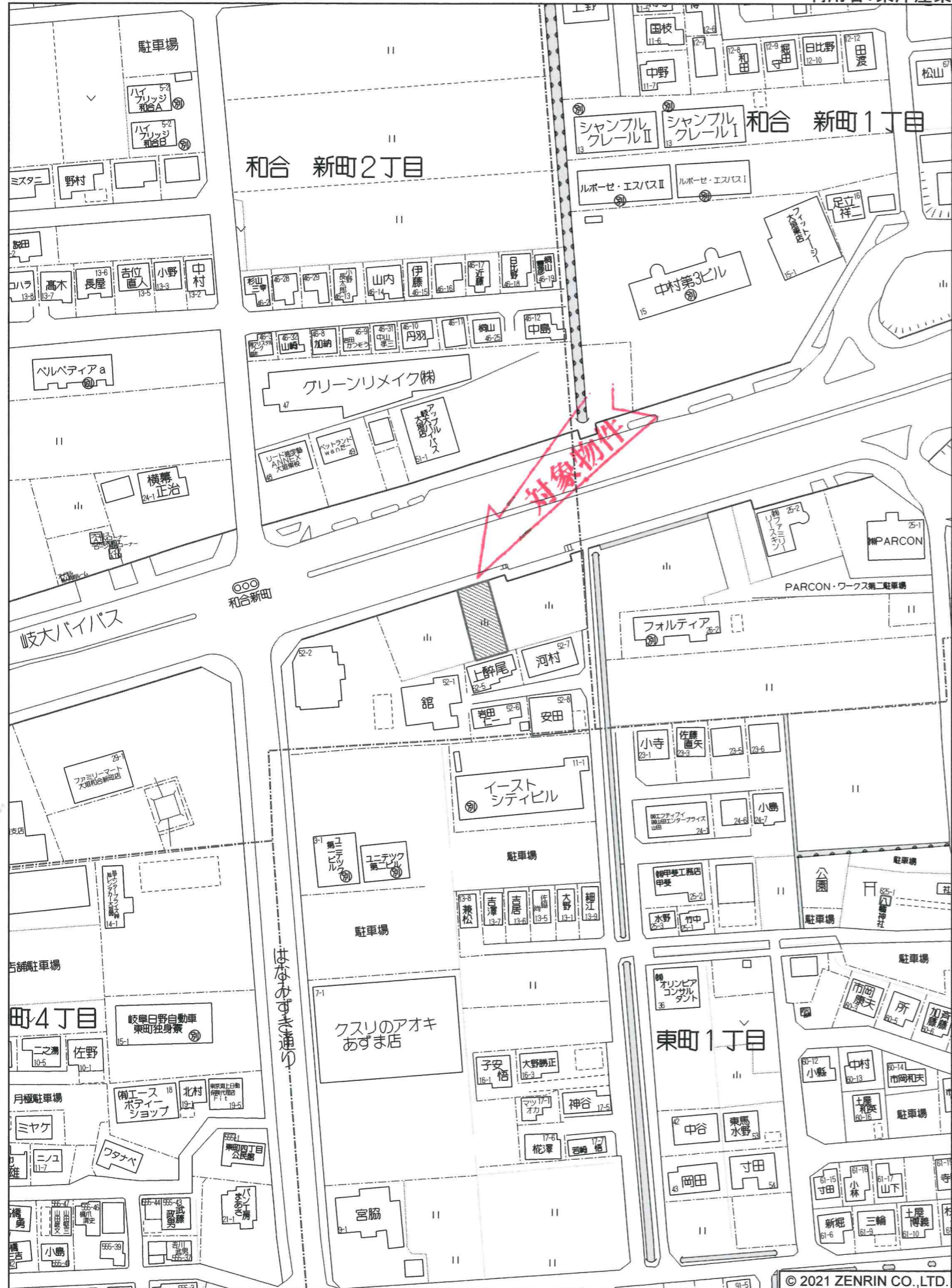
大垣市和合 新町2丁目付近