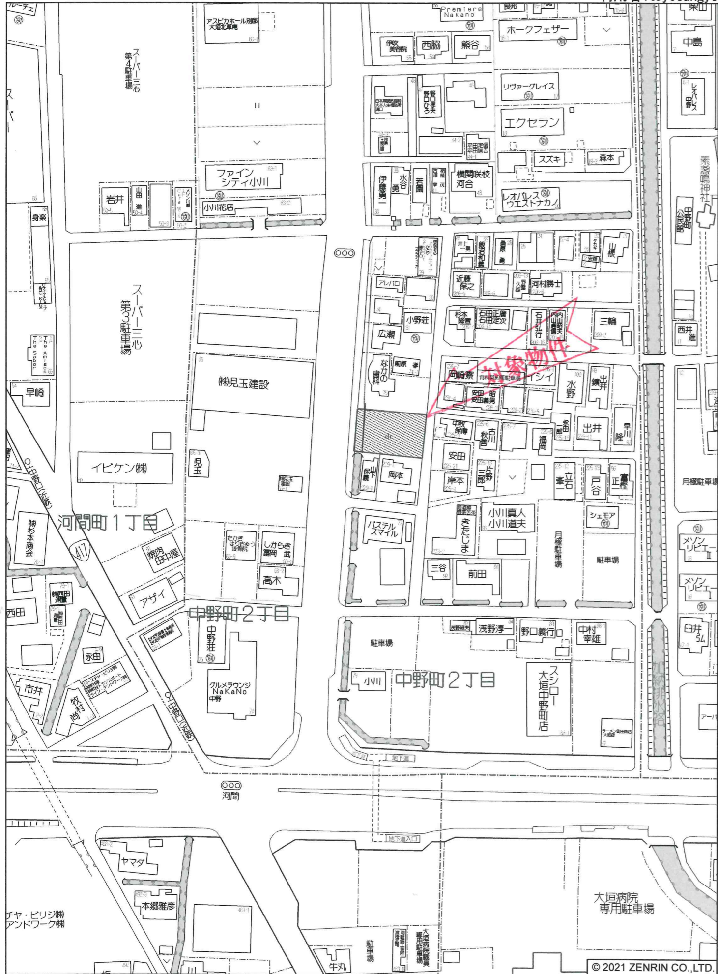
大垣市中野町2丁目付近