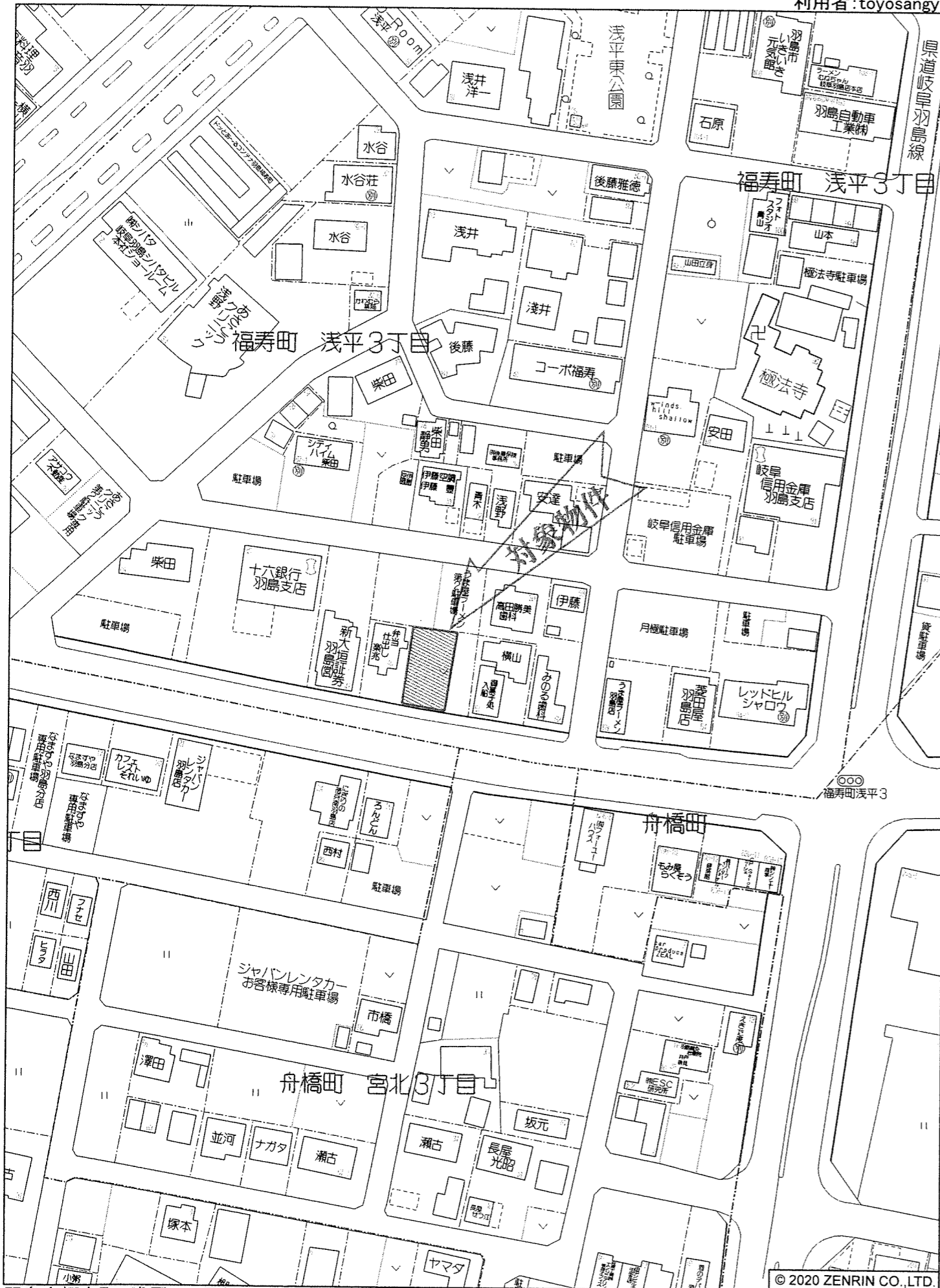
羽島市福寿町 浅平3丁目付近